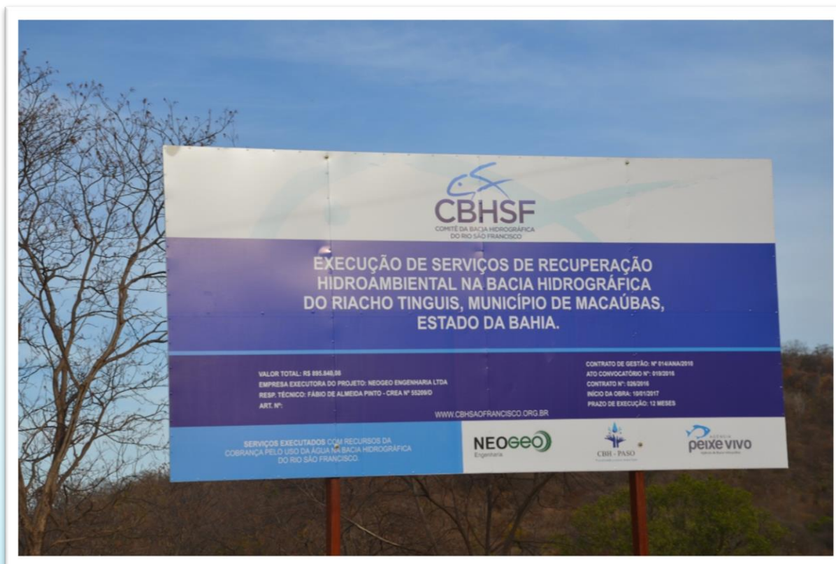
Placa de identificação do projeto