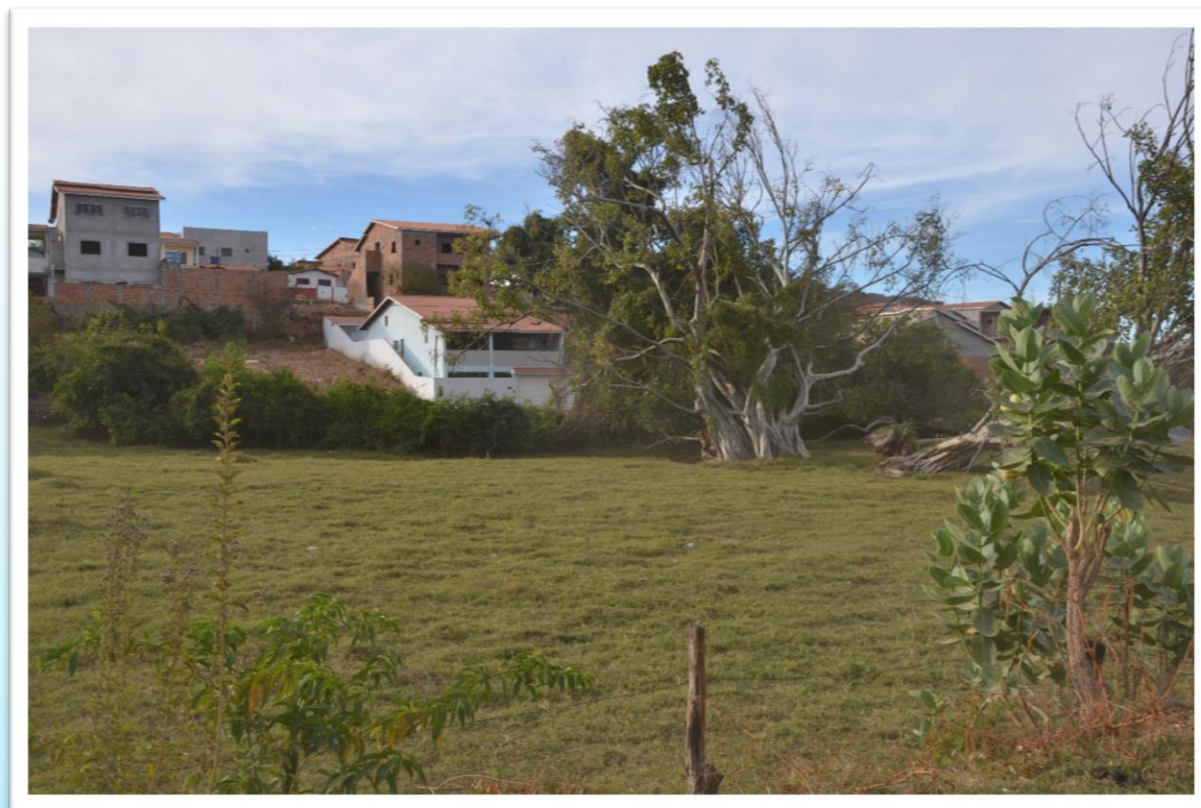
Área de preservação e implementação do viveiro de mudas