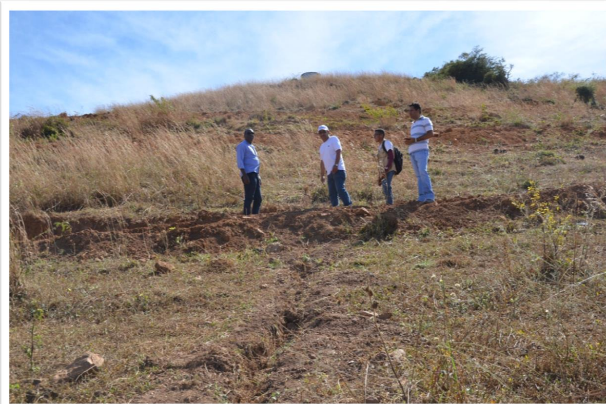
Equipe Técnica realizando medição de curva de nível em terreno muito inclinado