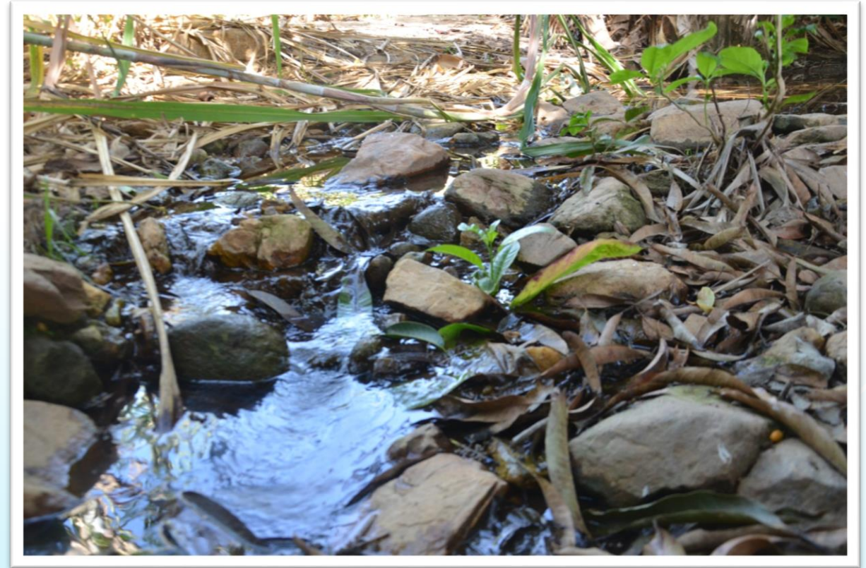
Nascente do rio