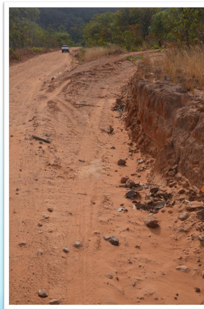
Curva de Nível