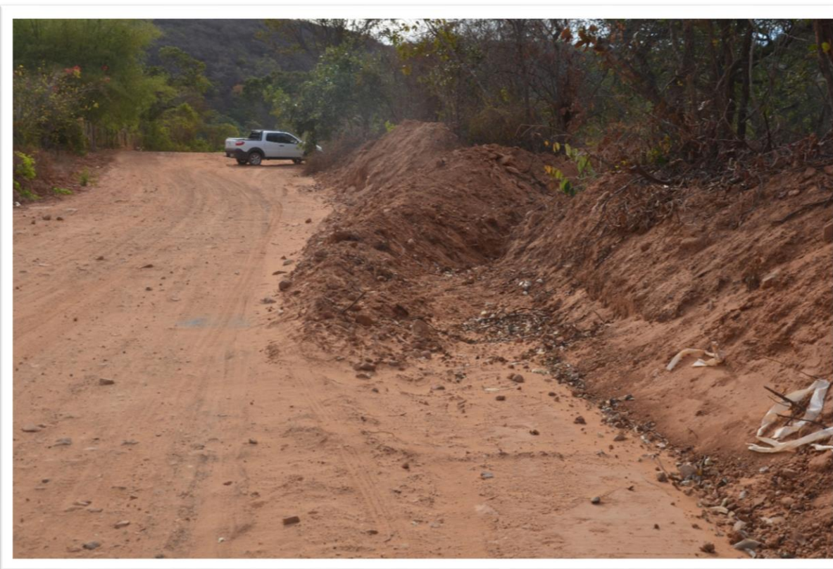
Curva de Nível