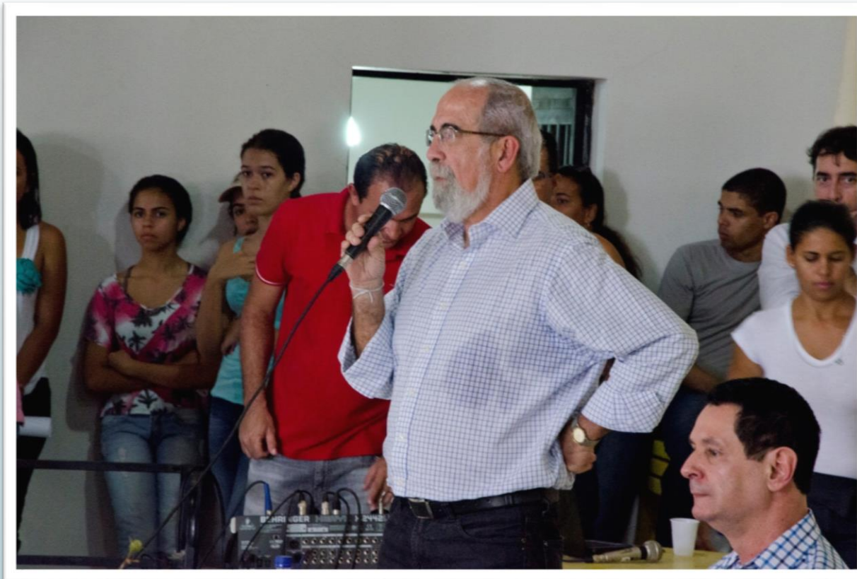
SR. BRUNO DAUSTER Secretário Estadual da Casa Civil do Governo do Estado da Bahia