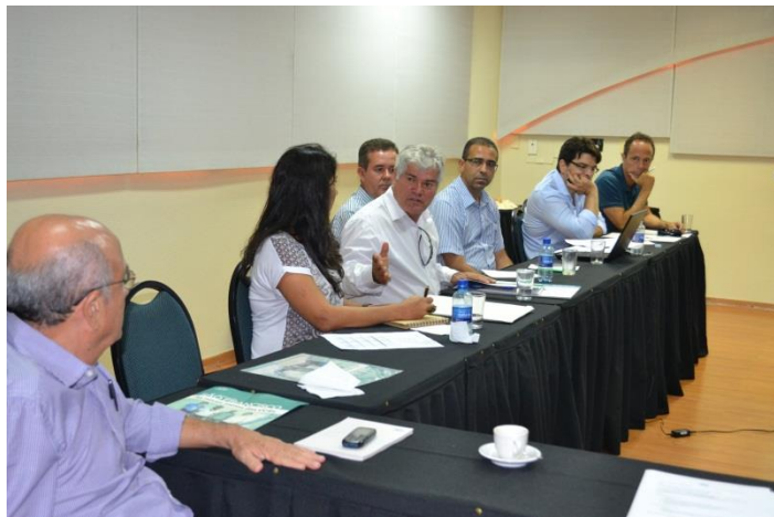
Reunião de Câmara Técnica