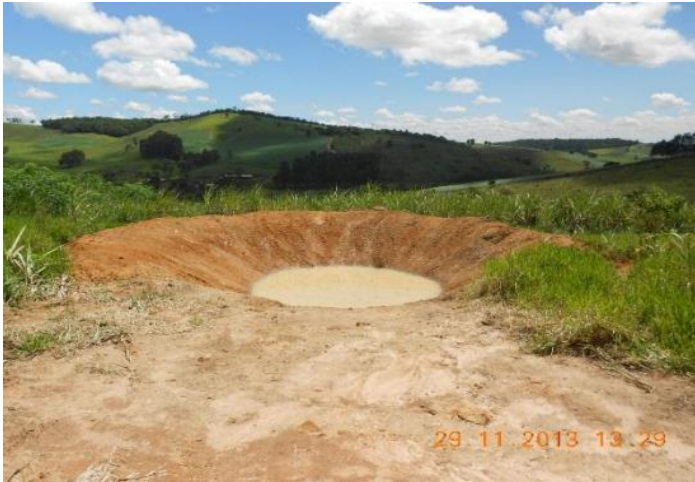
Bacia de captação (Conselheiro Lafaiete - MG)