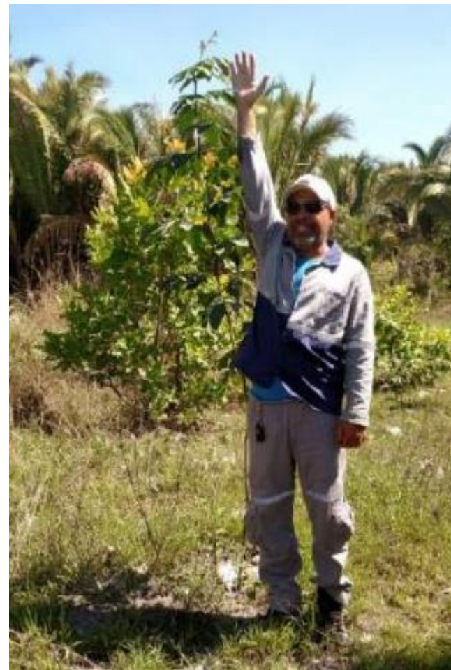
Plantio de mudas nativas (São Desidério - BA)