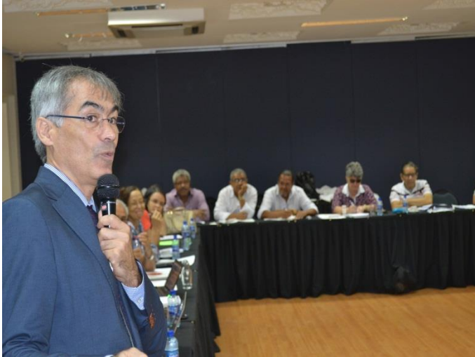
Reunião do GAT / CBHSF