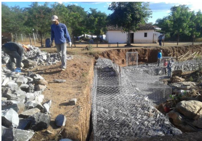
Estabilização de erosão (S. Maria da Vitória - BA)