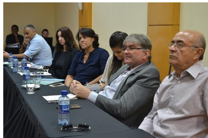
Resolução de conflito de uso da água