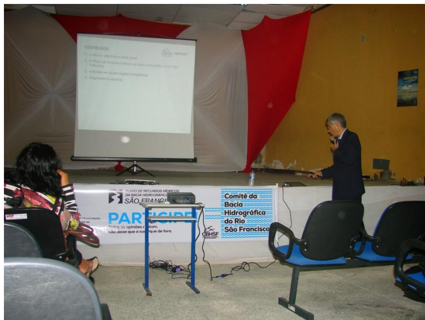
Oficina Setorial: Indústria e Mineração, em Jacobina - BA