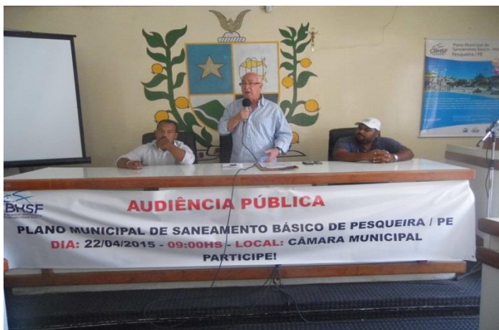
Pesqueira - PE