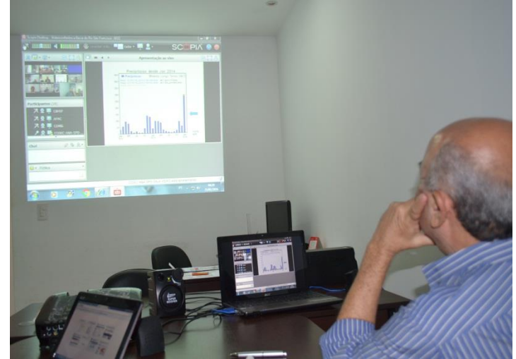
Reunião GTSF (ANA, Órgãos gestores e CBHSF)