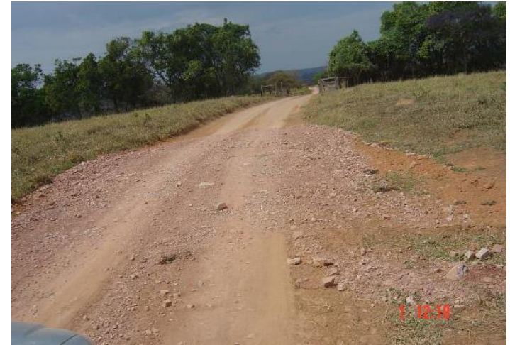
Adequação de estrada rural (Divinópolis - MG)