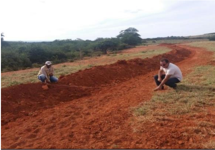
Construção de terraços (Morro do Chapéu - BA)