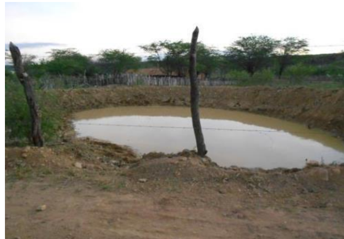
Bacia de captação (Brejinho - PE)