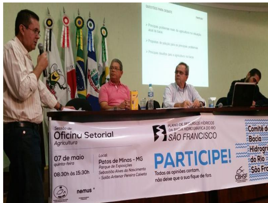
Oficina Setorial: Agricultura, em Patos de Minas - MG