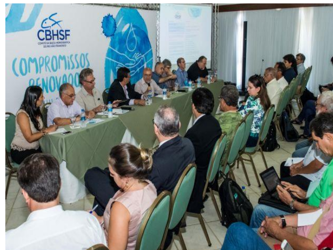
Reunião Plenária do CBHSF