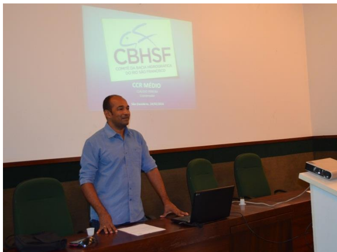
Reunião das Câmaras Consultivas Regionais