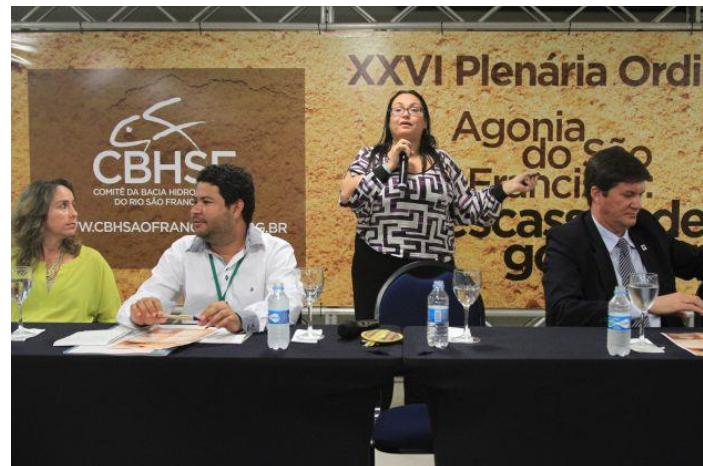
Reunião Plenária do CBHSF