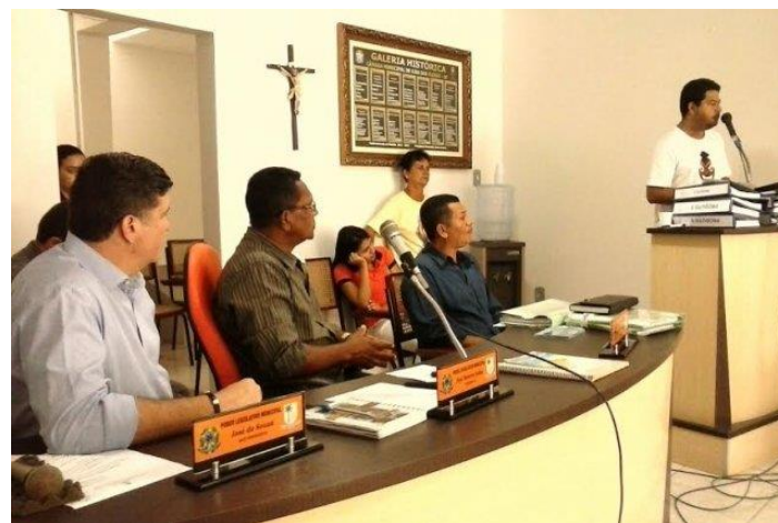
Ilha das Flores - SE