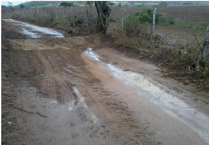
Adequação de estradas (Feira Grande - AL)