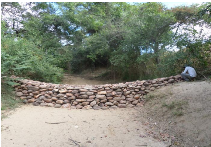
Dique de contenção (Paratinga - BA)