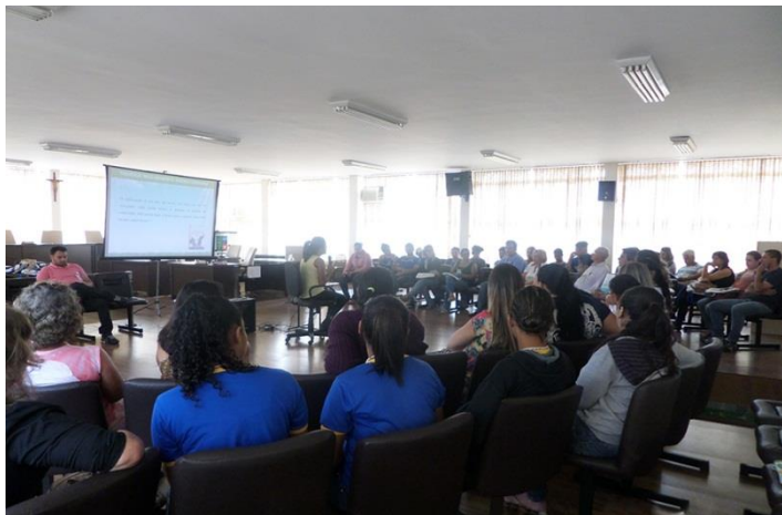
Abaeté - MG