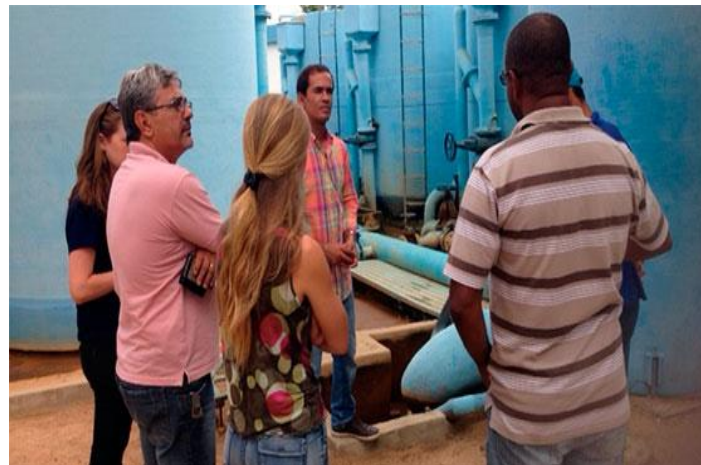
Barra - BA