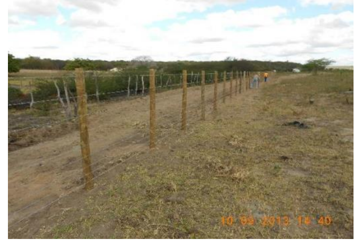
Cercamento de APP (Ibimirim - PE)