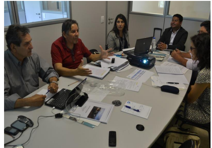
Reunião do GACG / CBHSF