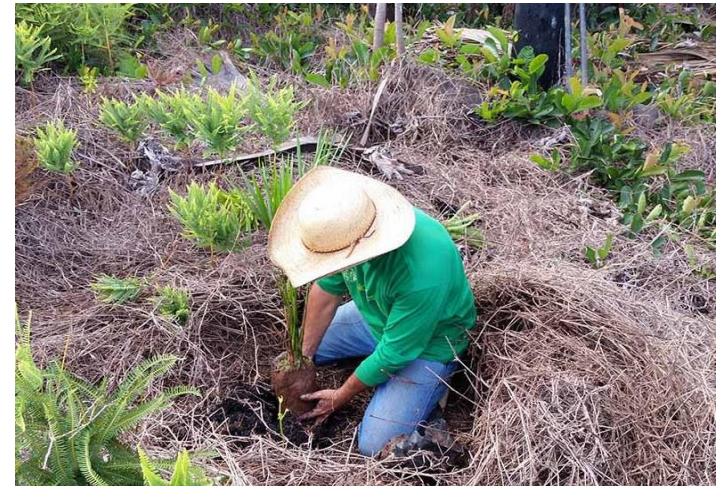
Plantio de mudas nativas (Junqueiro - AL)