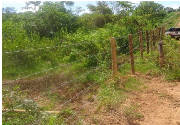
Cercamento de APP (Bocaiúva - MG)