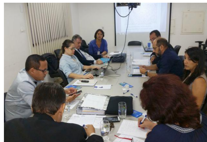
Mediação de conflito de uso da água