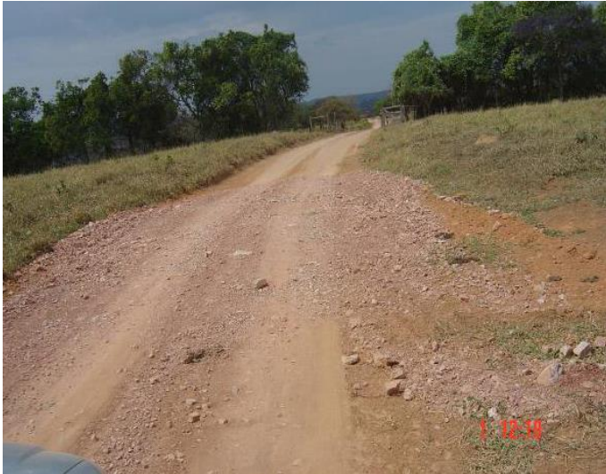
Adequação de estrada