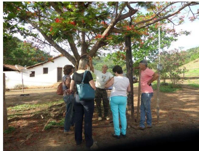
Uruana de Minas