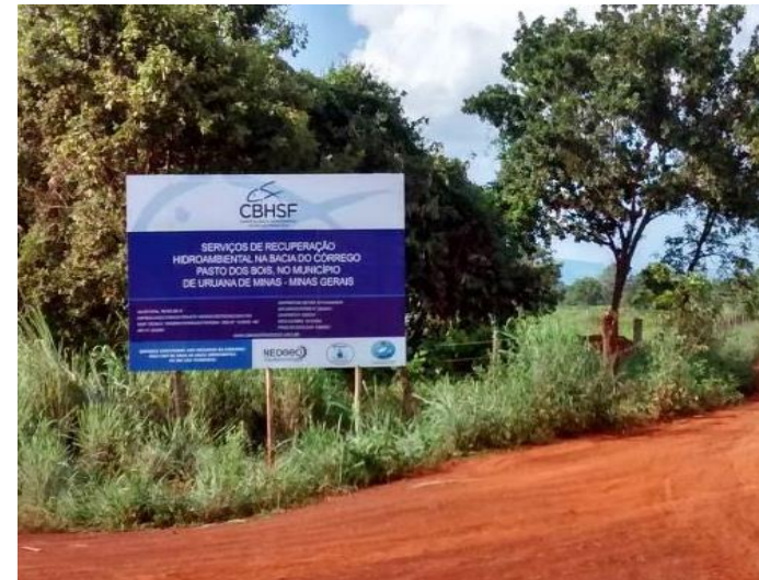
Placa de obra