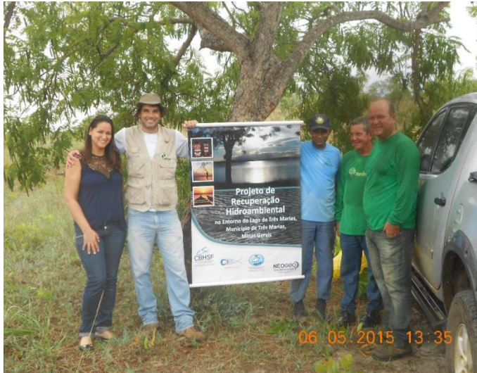
Divulgação do projeto