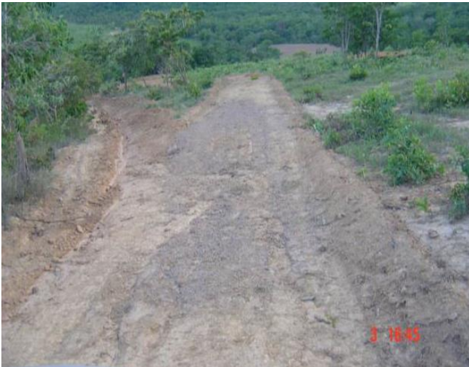
Adequação de estrada