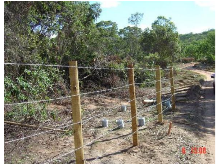
Cerca em construção