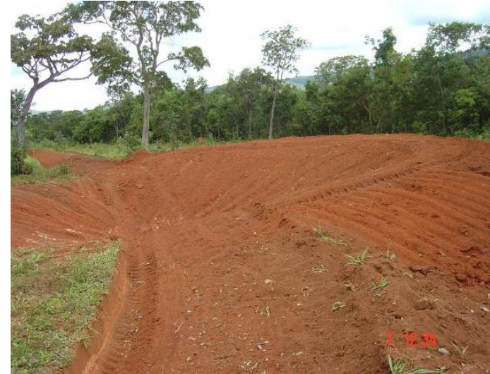
Bacia de contenção (barraginha)