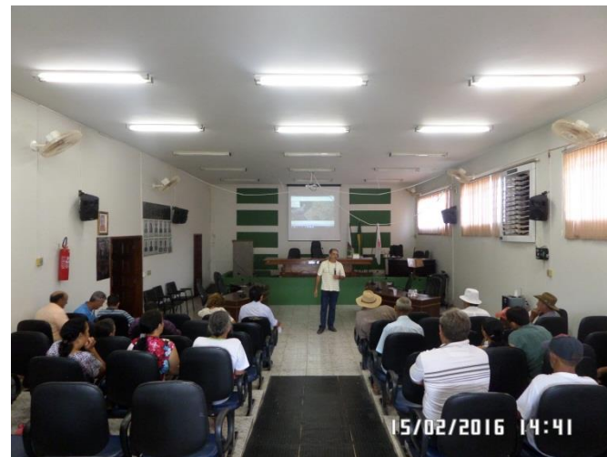
Uruana de Minas