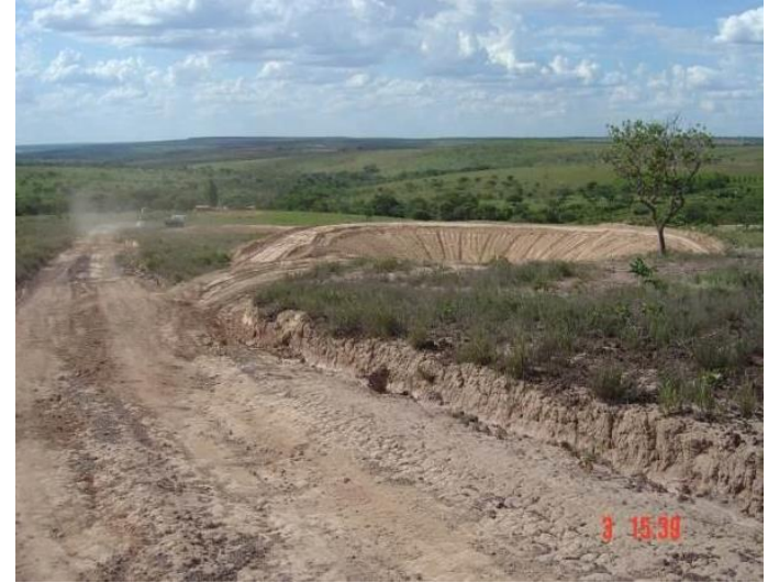
Bacia de contenção (barragem)