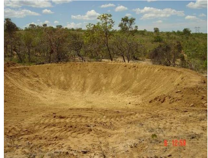
Bacia de contenção (barragem)