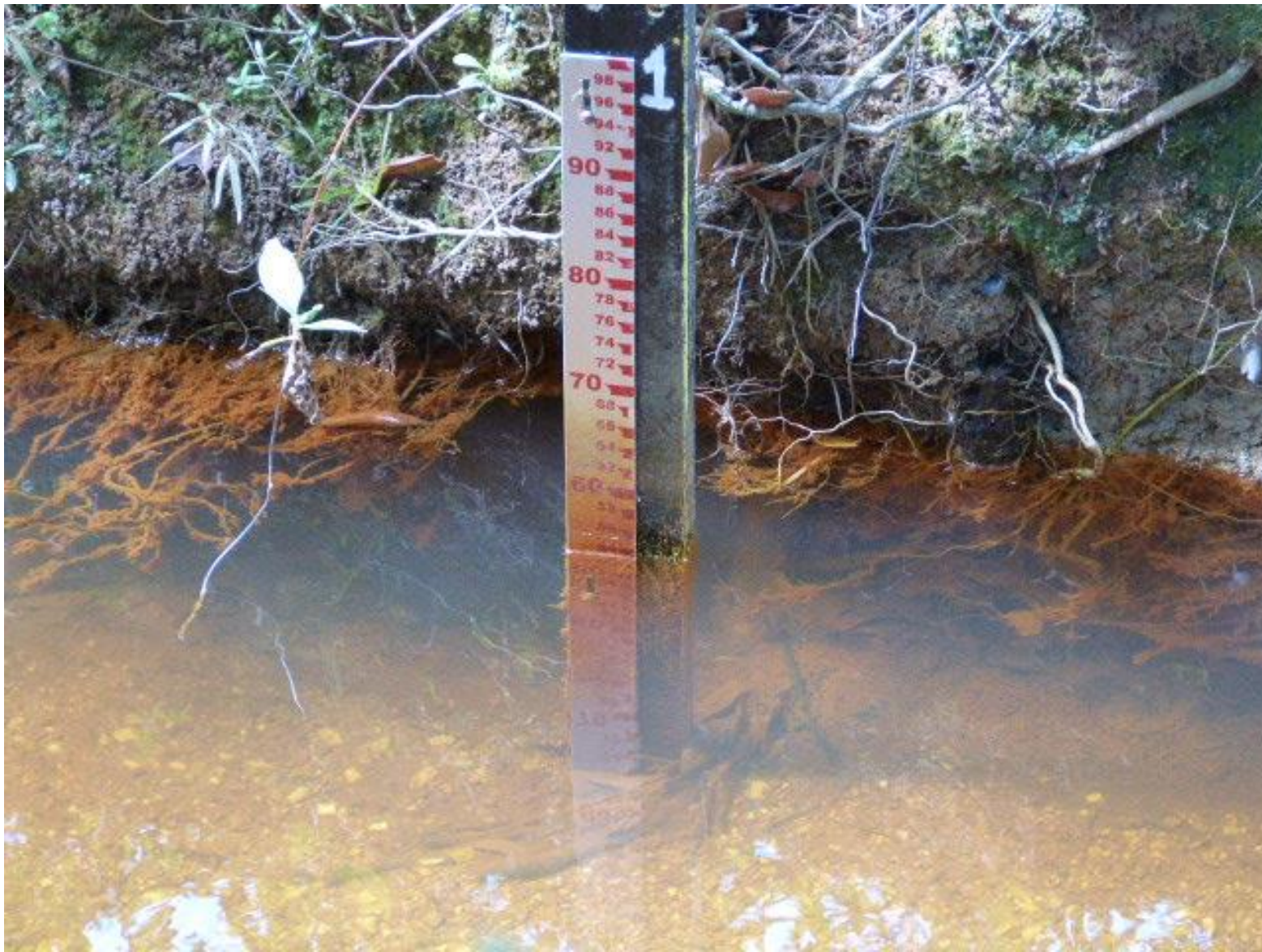
Régua para monitoramento de vazão