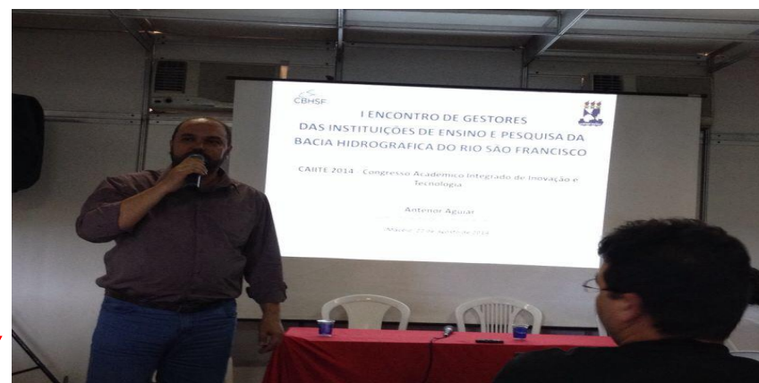
Encontro das Instituições Técnicas e de Ensino Superior (Maceió, 22/08/2014)