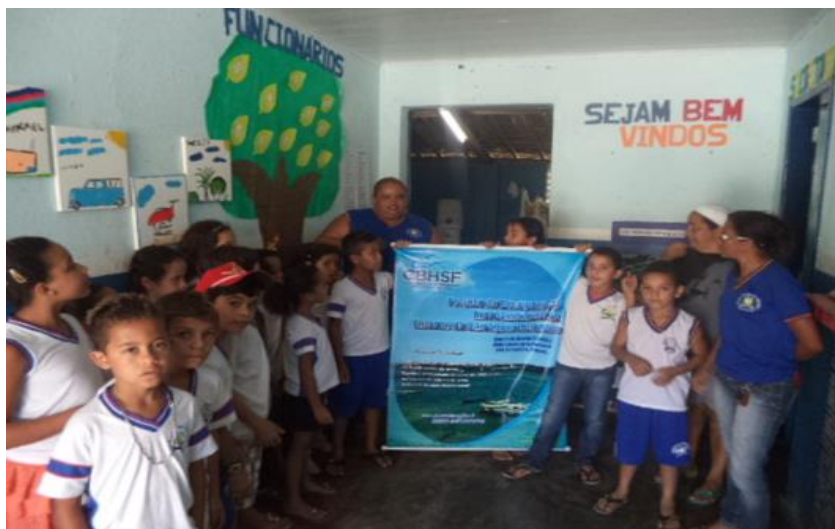
Junqueiro-AL (mobilização social)