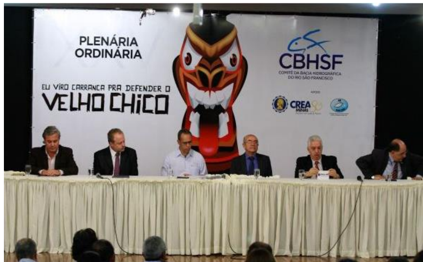
XXV Plenária Ordinária (Belo Horizonte, 22 e 23/05/2014)