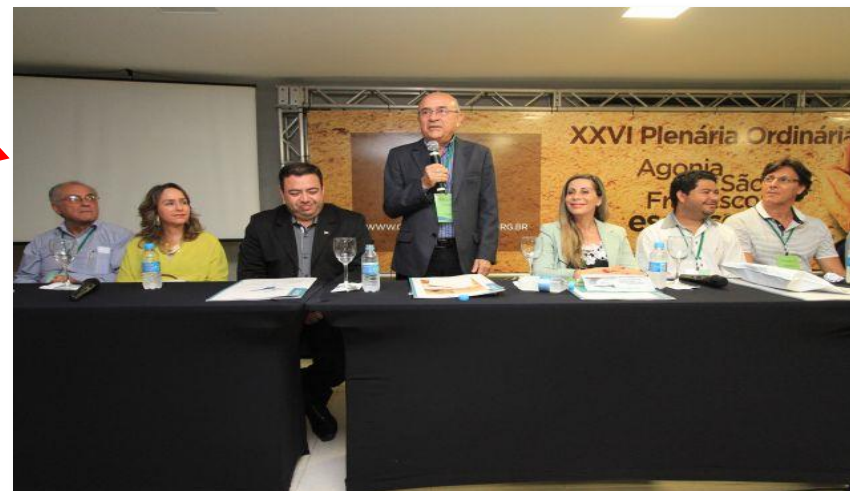
XXVI Plenária Ordinária (Maceió, 20 e 21/11/2014)