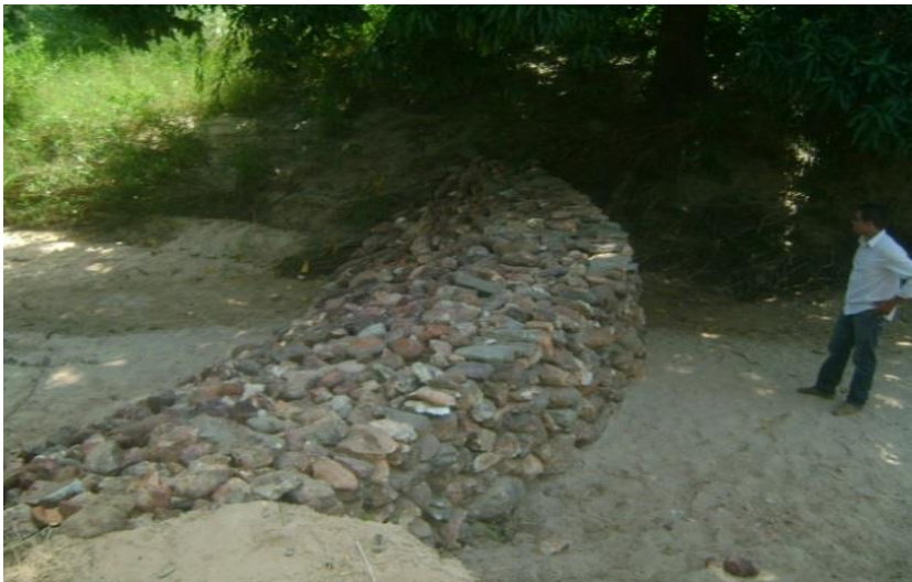
Dique p/ retenção de sedimentos