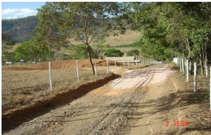
Divinópolis-MG (adequação de estrada)