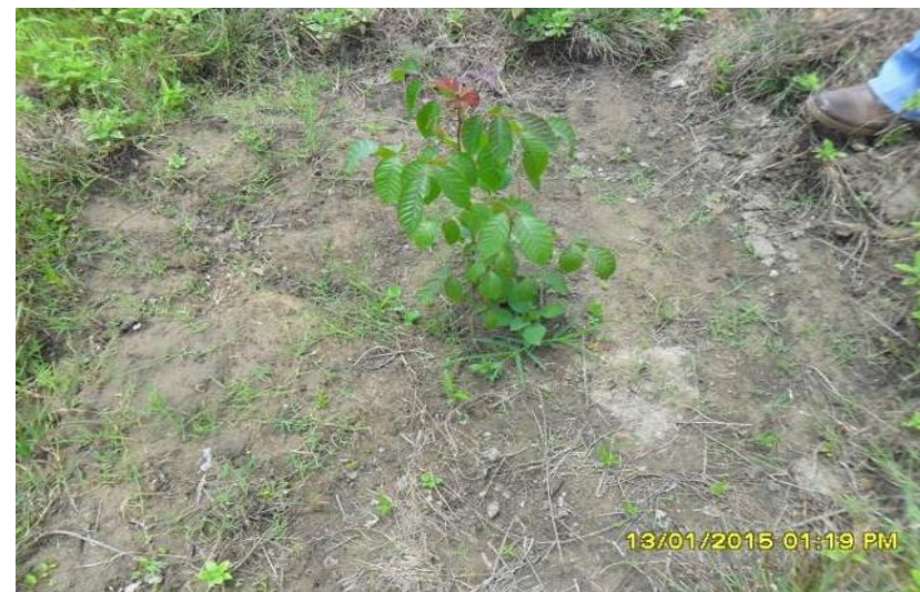
Catolândia-BA (plantio de muda nativa)