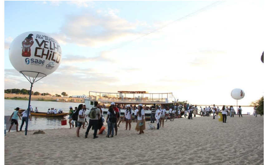
Petrolina / PE