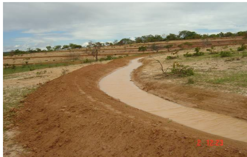
Felixlândia-MG (terraço em nível)