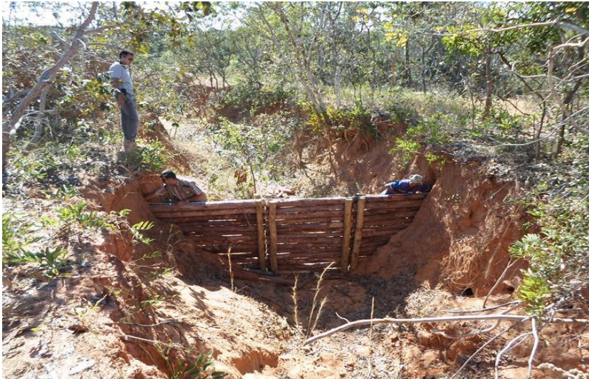
Contenção de voçorocas (paliçada)