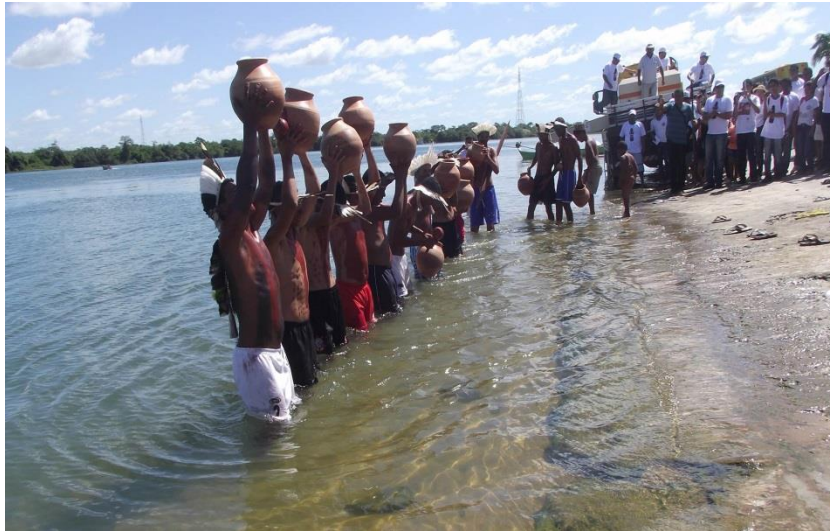
Penedo / AL