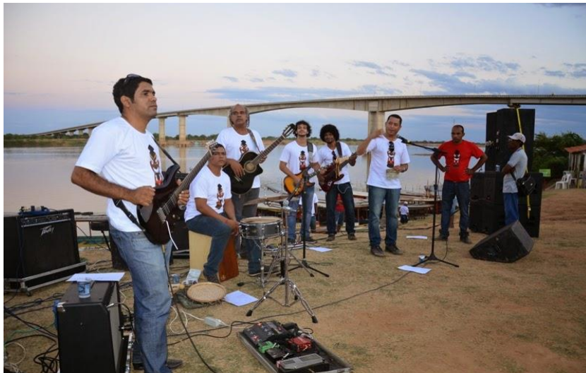
Bom Jesus da Lapa / BA