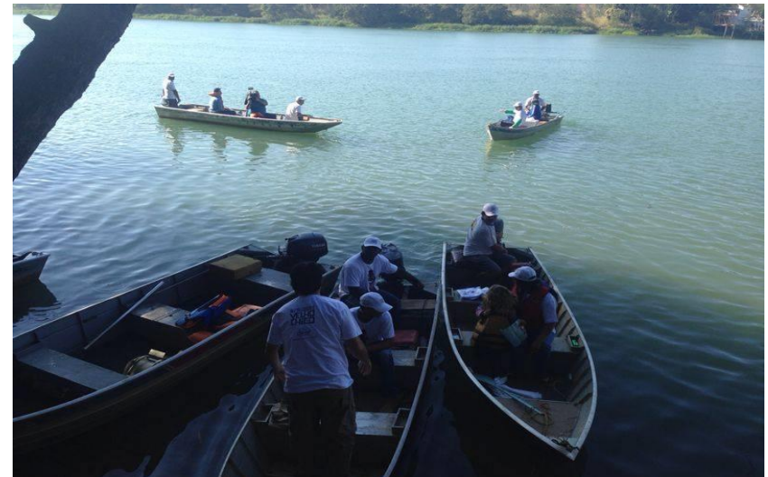
Três Marias / MG