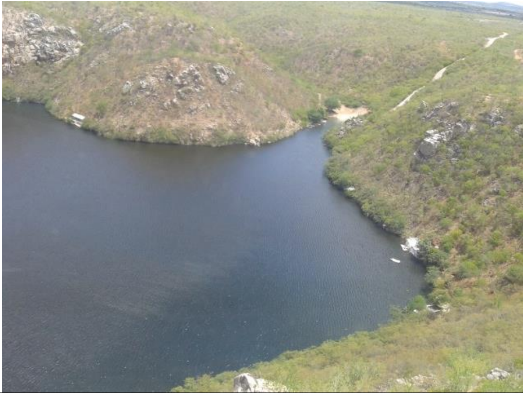
Figura 3 – Imagem da mancha no leito do Rio São Francisco, registrada no sobrevôo do dia 13/04/2015. Área da Captação Salgado.