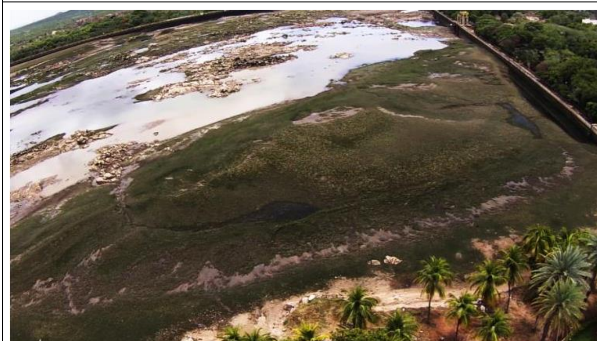
Figura 14 – Imagens do deplecionamento do Reservatório Delmiro Gouveia