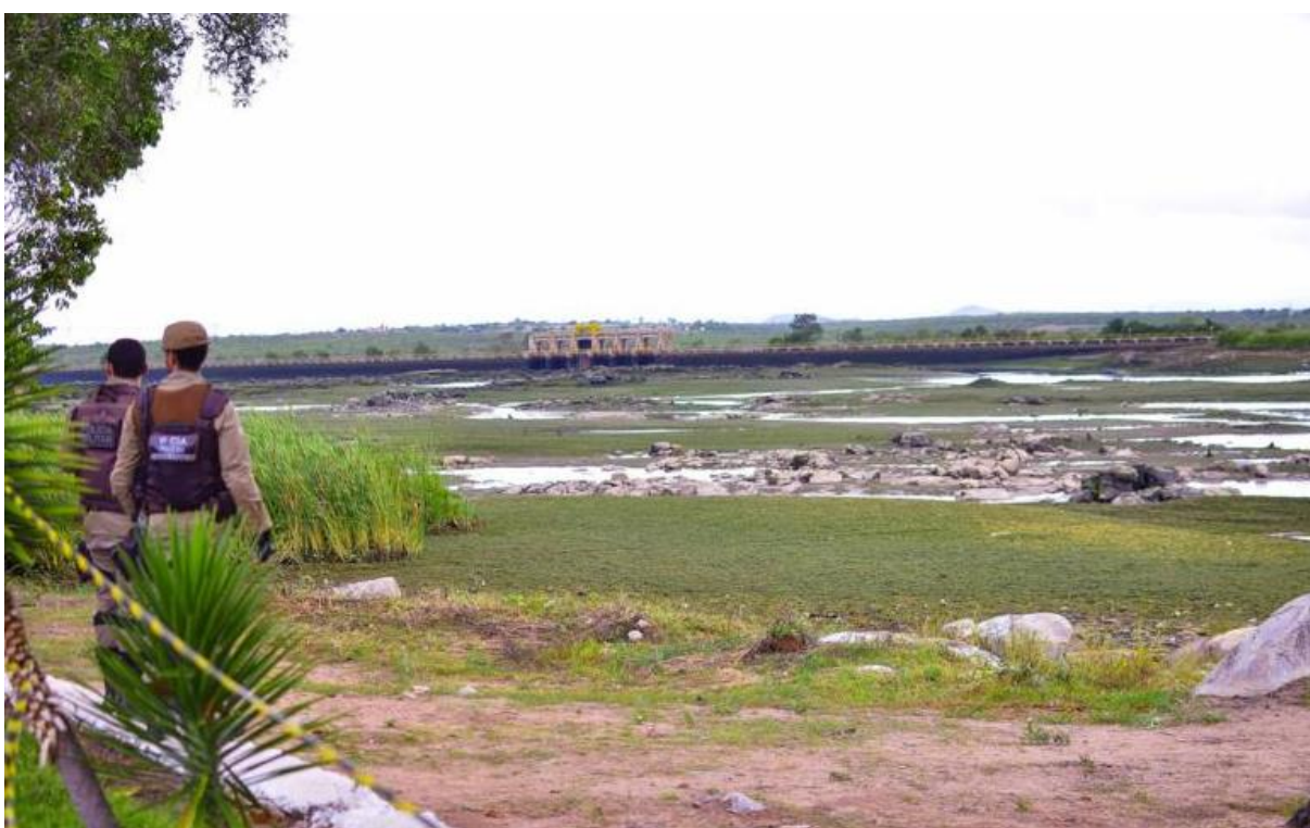
Figura 10 – Imagens do deplecionamento do Reservatório Delmiro Gouveia (fonte: http://www.ozildoalves.com.br/internas/read/?id=23126 )