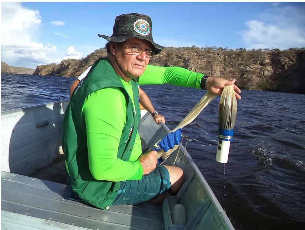
Figura 8 – Coleta que permite informar o percentual de fitoplâncton presente na pluma de contaminação e/ou poluição.