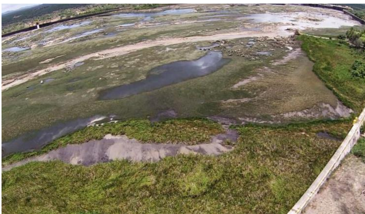
Figura 9 – Imagens do deplecionamento do Reservatório Delmiro Gouveia