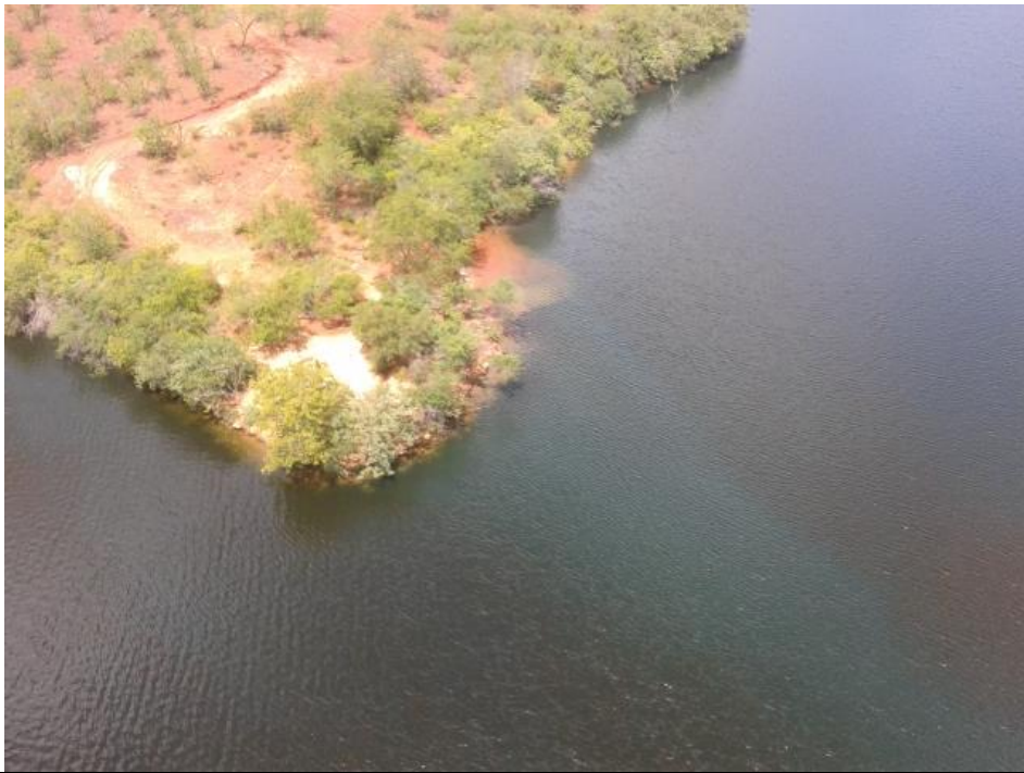
Figura 5 – Imagem da mancha no leito do Rio São Francisco, registrada no sobrevôo do dia 13/04/2015.