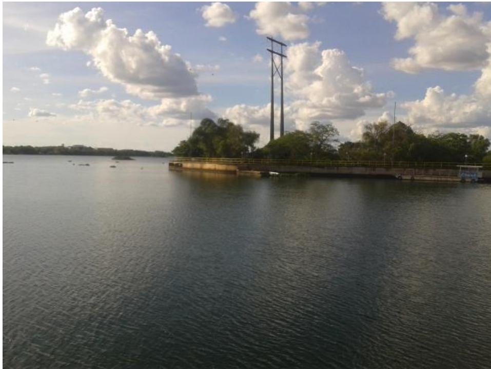
Figura 7 – Lago Belvedere, onde foi realizada a operação de esvaziamento e enchimento. (Imagem de 13/04/2015)