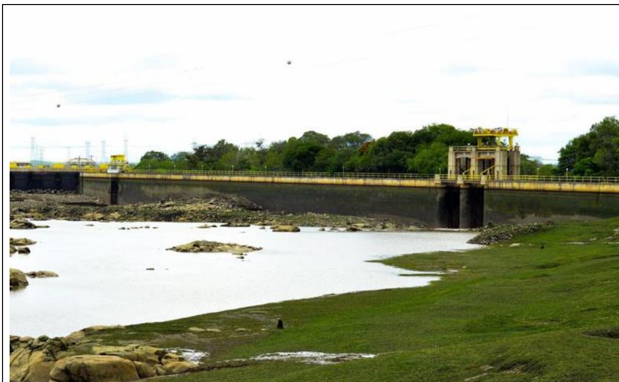
Figura 13 – Imagens do deplecionamento do Reservatório Delmiro Gouveia