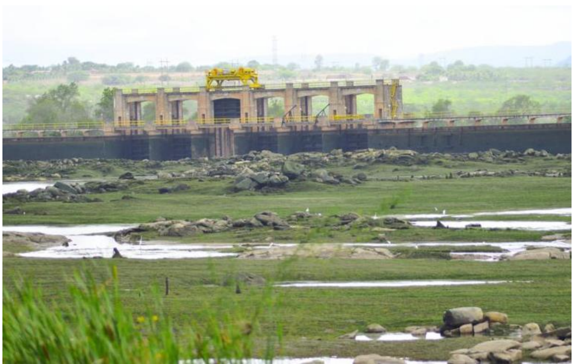
Figura 11 – Imagens do deplecionamento do Reservatório Delmiro Gouveia