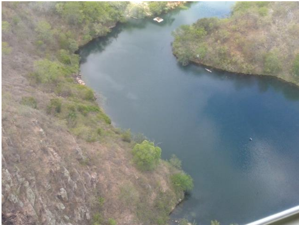
Figura 4 – Imagem da mancha no leito do Rio São Francisco, registrada no sobrevôo do dia 13/04/2015. Área da captação em Olho D'Água do Casado.