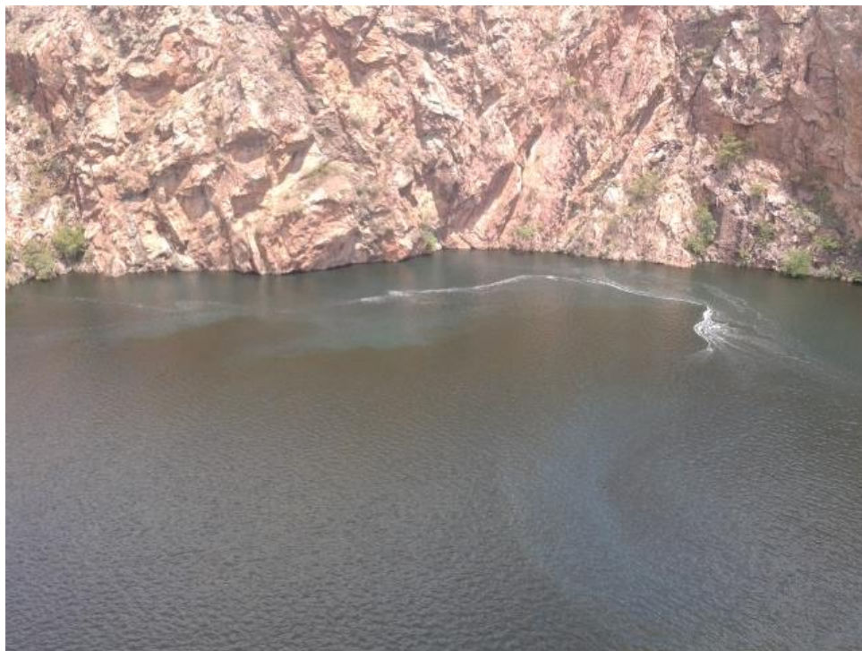
Figura 6 – Imagem da mancha no leito do Rio São Francisco, registrada no sobrevôo do dia 13/04/2015.