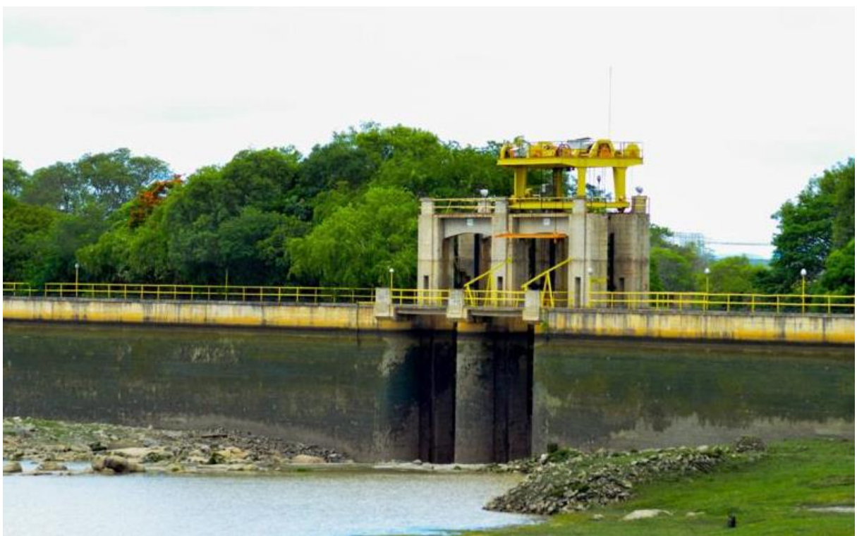
Figura 12 – Imagens do deplecionamento do Reservatório Delmiro Gouveia