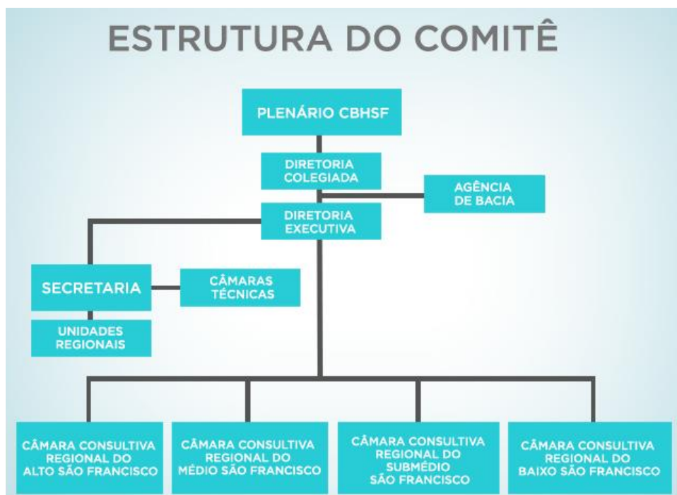
Figura 3.3 – Estrutura Organizacional do Comitê da Bacia Hidrográfica do Rio São Francisco