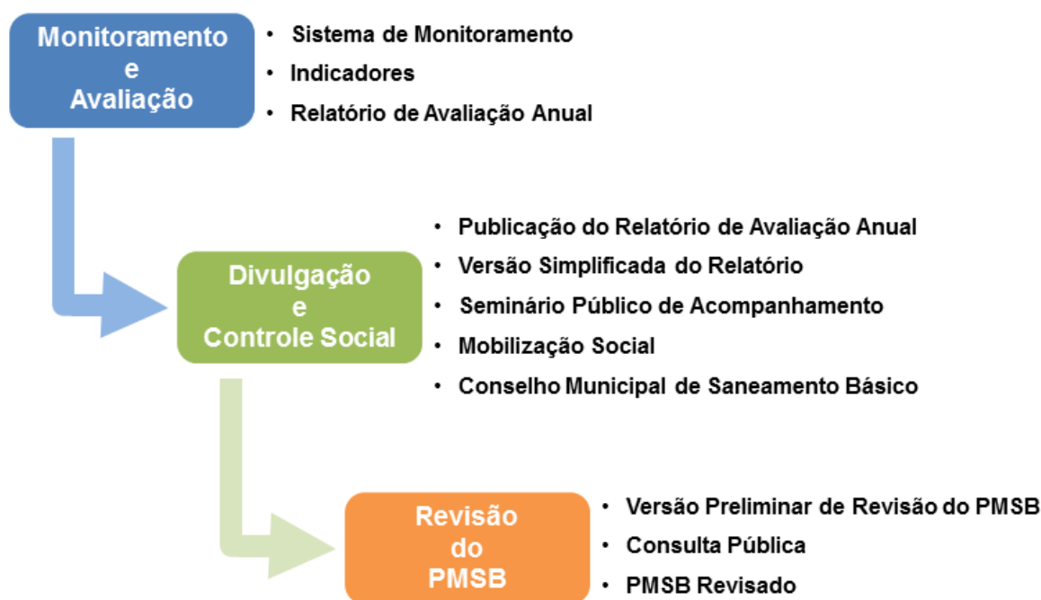
Figura 6.1 – Fluxograma da metodologia adotada

A Figura 6.1 ilustra as etapas e respectivos mecanismos estabelecidos neste documento.