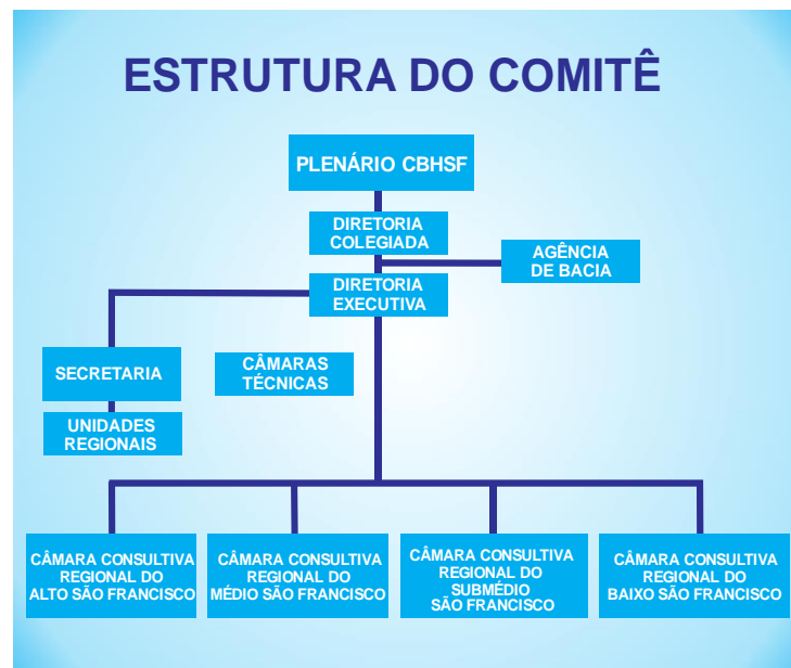
Figura 1 – Estrutura do comitê de bacia

O Comitê da Bacia Hidrográfica do Rio São Francisco é a entidade criada pelo Decreto Presidencial de 5 de junho de 2001 responsável pela gestão dos recursos hídricos na Bacia Hidrográfica do Rio São Francisco. Compreende, em sua área de atuação, seis Estados - Bahia, Alagoas, Sergipe, Pernambuco, Minas Gerais, Goiás – mais o Distrito Federal. Sua estrutura é composta por: Presidência, Vice-Presidência, Secretaria Executiva, Diretoria Colegiada, Diretoria Executiva, Plenário, Câmaras Técnicas e Câmaras Consultivas Regionais (Figura 1).