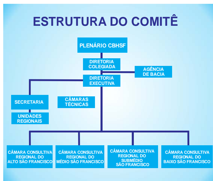
Figura 1 – Estrutura do comitê de bacia

O Comitê da Bacia Hidrográfica do Rio São Francisco é a entidade criada pelo Decreto Presidencial de 5 de junho de 2001 responsável pela gestão dos recursos hídricos na Bacia Hidrográfica do Rio São Francisco. Compreende, em sua área de atuação, seis Estados - Bahia, Alagoas, Sergipe, Pernambuco, Minas Gerais, Goiás – mais o Distrito Federal. Sua estrutura é composta por: Presidência, Vice-Presidência, Secretaria Executiva, Diretoria Colegiada, Diretoria Executiva, Plenário, Câmaras Técnicas e Câmaras Consultivas Regionais (Figura 1).